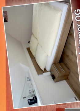
2. Schlafzimmer OG