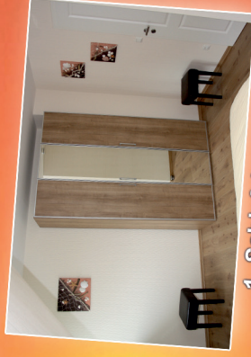
1. Schlafzimmer OG