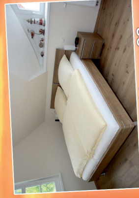
1. Schlafzimmer OG